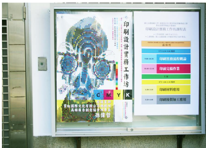
活動海報、活動流程張貼