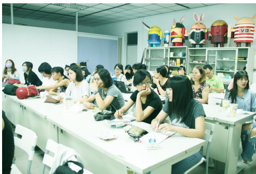
教室內部及參與同學