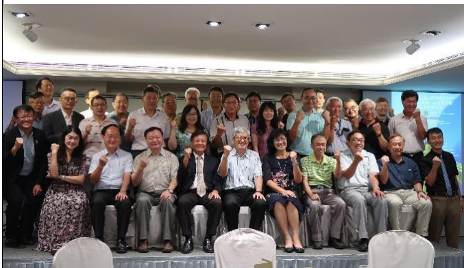
與會校友合影留念